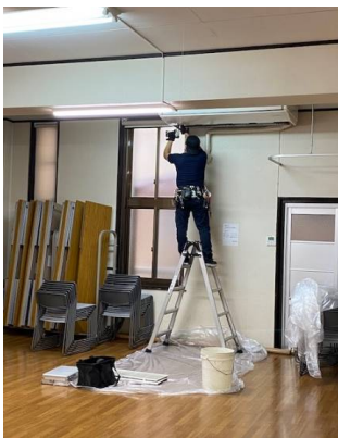
101室 エアコンパーツ取り外し