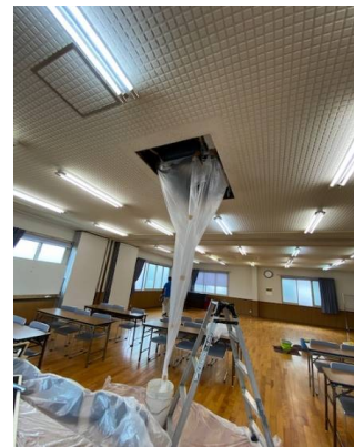
新館ホールのエアコン洗浄