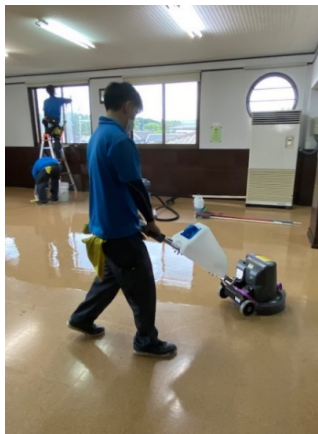
301室 床ワックス掛け