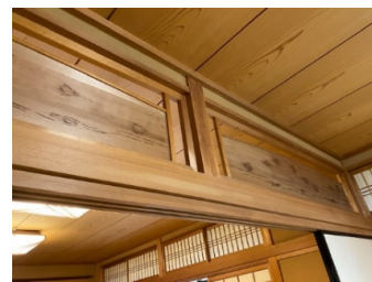
埃がはらわれて、きれいになった新館和室の欄間