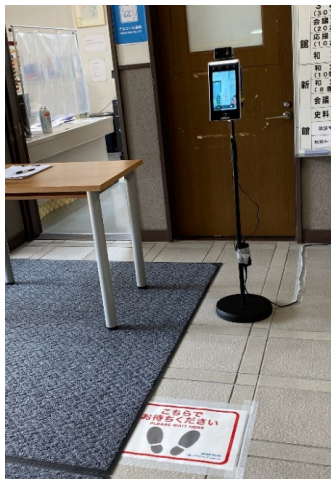
玄関ホール 事務所前に設置

玄関ホールに体温測定サーマルカメラを設置しました。（6ヶ月のレンタル） マスクを着用していない場合、自動的にマスク着用を促す音声アナウンスが流れます。 体温が37.3度以上の場合も、発熱があることを伝えるアナウンスがされます。