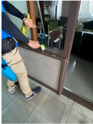
102室 窓枠清掃の様子