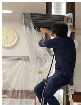
事務室のエアコン洗浄