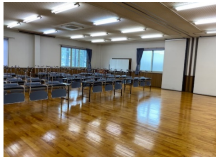
新館ホール ワックス掛けで美しく