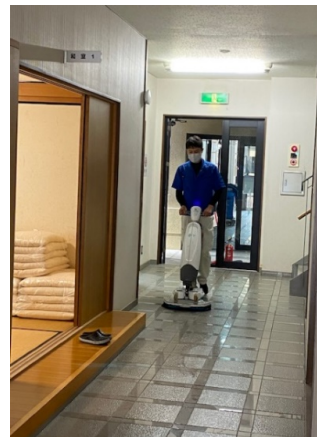
新館1階 廊下 洗剤洗浄