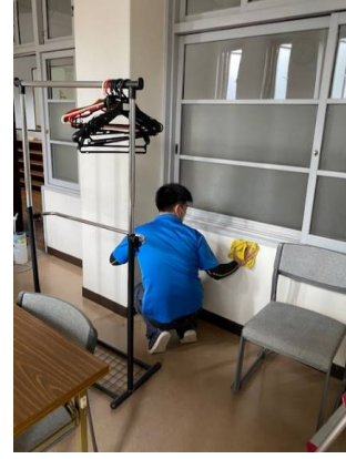
202室 壁面清掃の様子