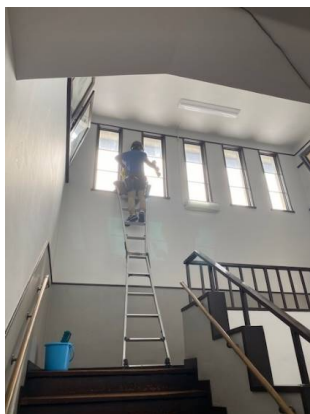
階段踊り場の窓清掃