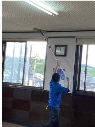
301室 天井清掃の様子