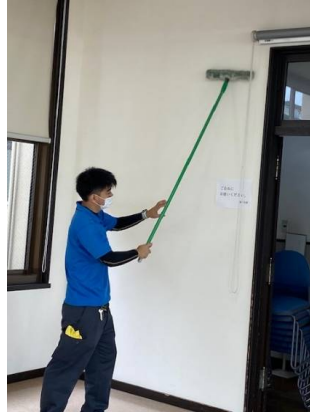
201室 壁面清掃の様子