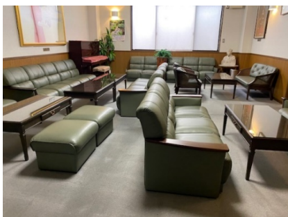
新館談話室 清掃後