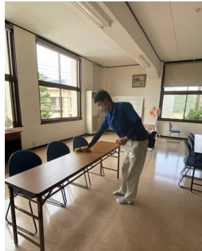
201室 テーブルの拭掃除

椅子やテーブルなどの備品は、アルコールや次亜塩素酸ナトリウム溶液などで、拭き上げられ、除菌されました。