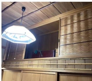
本館3階 天袋の清掃